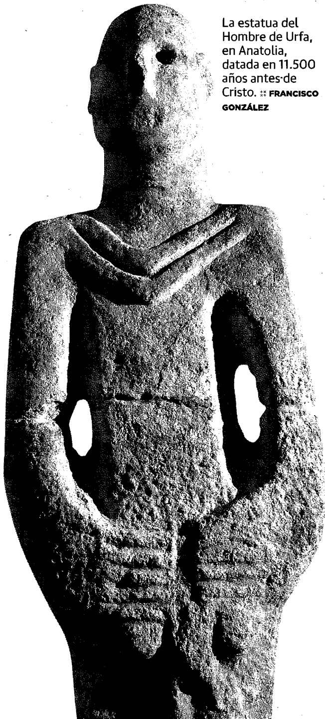
La estatua del Hombre de Urfa, en Anatolia, datada en 11.500 años antes de Cristo.